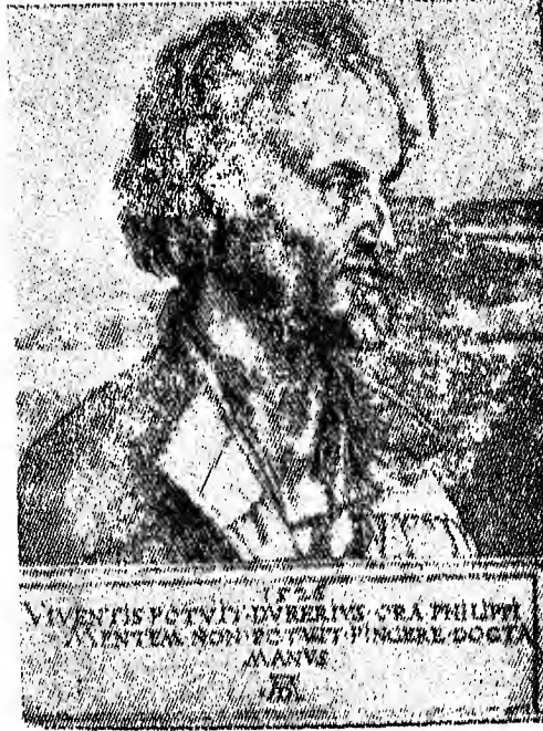
الصورة رقم (١) ألبرخت ديور : فيليب ميلانكتورن - متحف الفنون الجميلة في بوستن