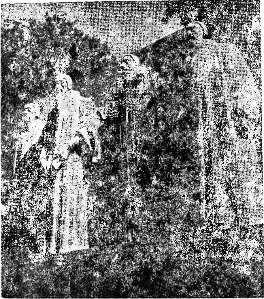
الصورة رقم (٥) النصب التذكارى للإصلاح الدينى (صفحة ٢٥٦)