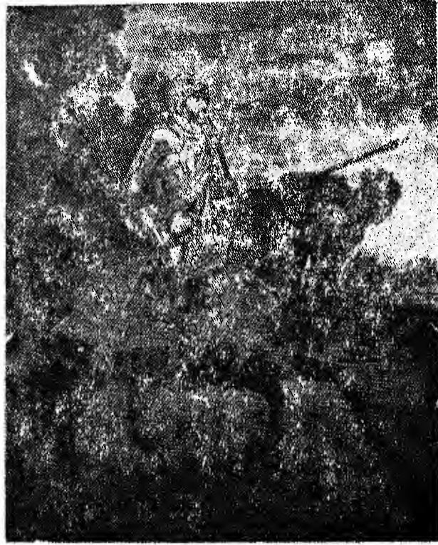
الصورة رقم (٣) تيتيان : شارل الخامس في موبلبرج - برادو ، مدريد ( صفحة ١٩٨ )