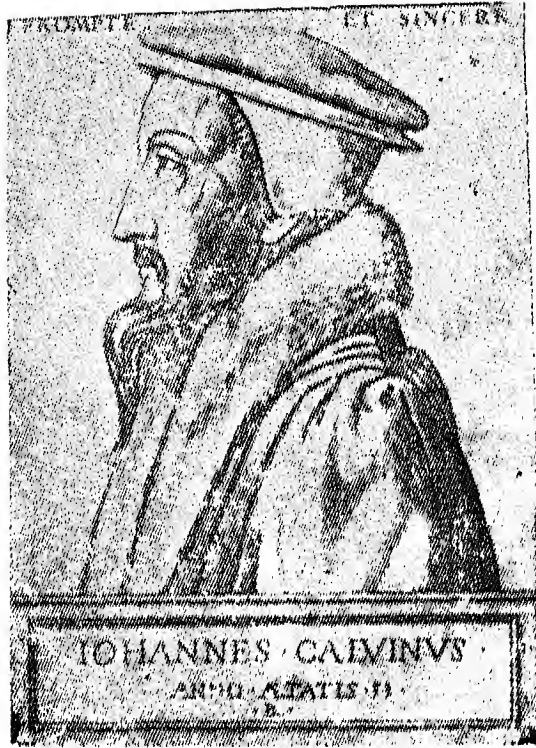
الصورة رقم (٤) رتيبه بويفن : كالفن - المكتبة العمومية والجامعية بجينيف (صفحة ٢٣٥)