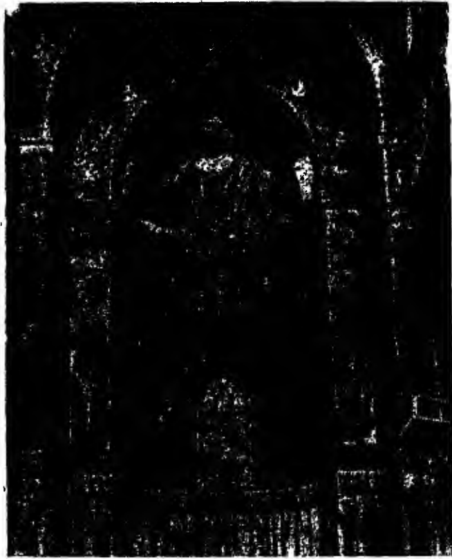
(شكل ٤) كوة معقودة في كنيسة منتريال